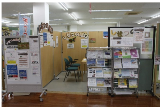
ショッピングセンター内にある相談コーナー 手作り感いっぱいです。

普段の生活では考えない福祉のことや、健康のことについて、少しでも地域の方に理解をしてもらえるように取り組んでいます。